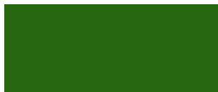
Forest Green 754