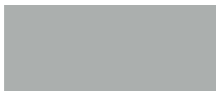
Goosewing Grey 222