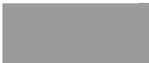
Mid Grey 280