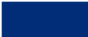
Traffic Blue 466